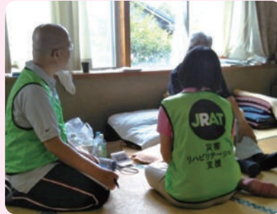
アセスメント・個別指導