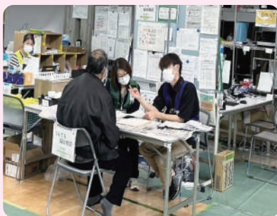
なんでも相談窓口