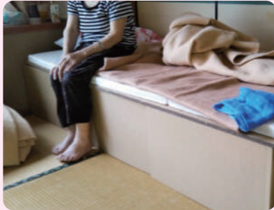
ダンボールベッドの設置