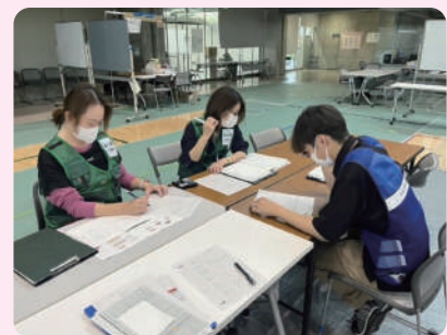
他支援チームとの情報共有