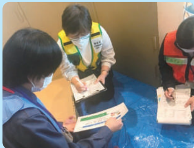
避難所設置・運営訓練の様子

市町が実施する総合防災訓練に、チームの参加協力をご希望する担当者様は裏面の「愛媛県社会福祉協議会法人振興課」までご連絡ください。