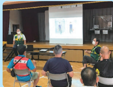
生活不活発病予防の体操指導