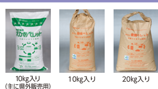
10kg入り (主に県外販売用) 10kg入り 20kg入り