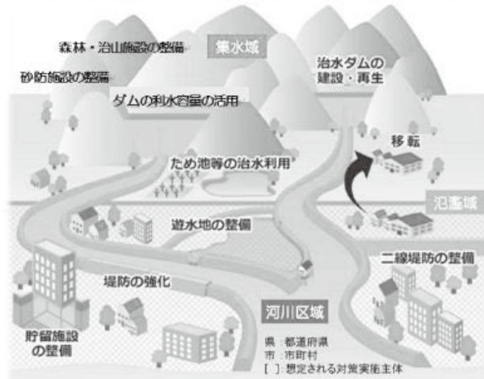
(流域治水プロジェクトイメージ)

河川管理者を含む、あらゆる関係者(国・県・市町・企業・住民等)の協働により流域全体で行う治水「流域治水」へ転換するため、「流域治水プロジェクト」を示し、ハード・ソフト一体となった事前防災対策を加速させ、地域住民の安全・安心の確保を図るものである。