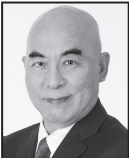
ひゃくたなおき 日本保守党 代表 ベストセラー小説『永遠の0』作者