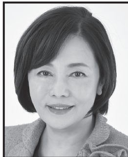
ありもとかおり 日本保守党 事務総長 ジャーナリスト