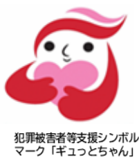
犯罪被害者等支援シンボル マーク「ギョつとちゃん」