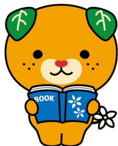
愛媛県イメージアップキャラクター みきやん