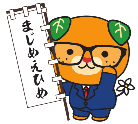
愛媛県イメージアップキャラクター「みきゃん」

住所 〒790-8570 愛媛県松山市一番町四丁目4番地2 電話 089-912-2151 ファクス 089-921-6363 Eメール soumukanri@pref.ehime.lg.jp ホームページ ふるさと愛媛応援サイト https://www.pref.ehime.jp/h10100/furusatonoze/right.html ふるさとチョイス https://www.furusato-tax.jp/city/product/38000