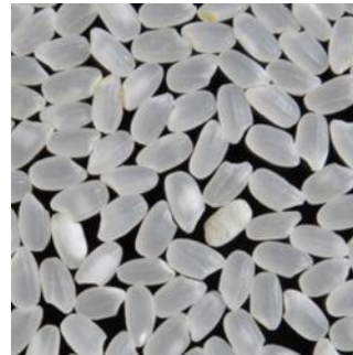
ヒノヒカリ（精白米）