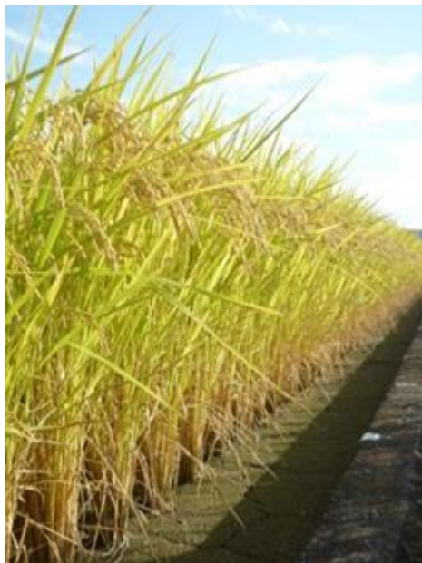
高温に強く、コンパクトで倒れにくい