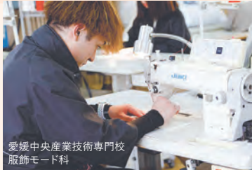
愛媛中央産業技術専門校 服飾モード科

県立産業技術専門校では、就職を目指す方々を対象に、タオルづくりや金属加工など、ものづくりを学ぶ職業訓練を実施しています。新居浜産業技術専門校と愛媛中央産業技術専門校では、9/26(月)から前期試験の願書受け付けを開始します。専門的な知識や技能を学んで、就職を目指しませんか？ ④ 9/26(月)～10/21(金)までに、各校へ願書を提出