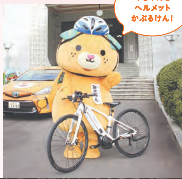
みきやんもヘルメットかぶるけん!