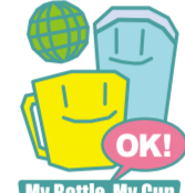
My Bottle, My Cup

学校やオフィス、外出先 などでも自分の水筒などの 飲料容器をそのときどきの 状況に応じて使って いこうという取り組みです。