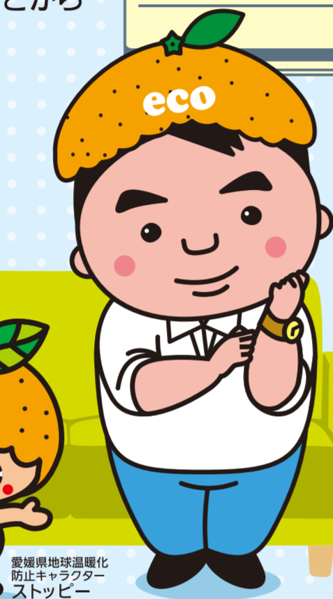
愛媛県地球温暖化 防止キャラクター ストップビー

毎日の生活のなかで 環境にやさしい行動を 心がけている「エコ家族」。 上手なエコライフを のぞいてみよう!