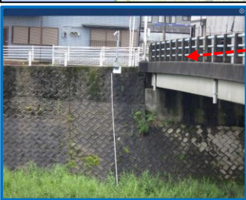
設置状況の写真が表示されます。