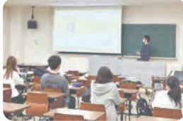
▲松山大学での活動の様子

「あいサポーター研修」で障がいのある方のお話を聞いたことは、とても貴重な経験に。障がいのある方がどんなことで困っているのか、これまでの知識のインプットでは想像できなかったことを知り、実際に体験してみることやお話を聴くことの大切さを学びました。今後は、車いす体験や色弱体験、地域のボランティア活動に参加するなどして、実際に「経験すること」に力を入れたいと考えています。また、研修でいただいた「あいサポートバッジ」を胸に、私たちのちょっとした手助けや配慮が誰もが暮らしやすい温かな社会づくりの力になると意識し、自分たちにできることを実践していこうと思います。