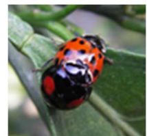
ナミテントウ(天敵)