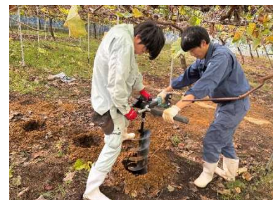
土壤物理性の改善試験