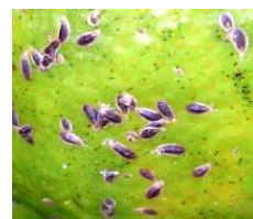
ヤノネカイガラムシ