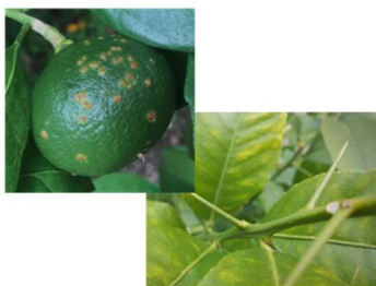
問題となる形質を改善し、優良な品種を作出

従来の交雑育種より短期間で品種育成が可能な「ゲノム編集」技術を活用するため、改善すべき形質を制御する遺伝子の探索や植物体再生技術の確立、ゲノム編集の効率化について、みかん研究所と連携し取り組んでいます。