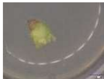
植物体再生技術の確立