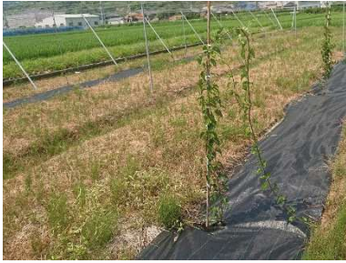
水田転換園で耐湿性台木の試験

開花前から開花期の連続降雨は、花腐細菌病の多発や受粉不良を引き起こします。また、梅雨時期の連続降雨により根が衰弱し、その後の高温乾燥で根からの吸水が間に合わず立枯れ状態になってしまいます。近年多発する異常気象等の影響を克服する安定生産技術を開発します。