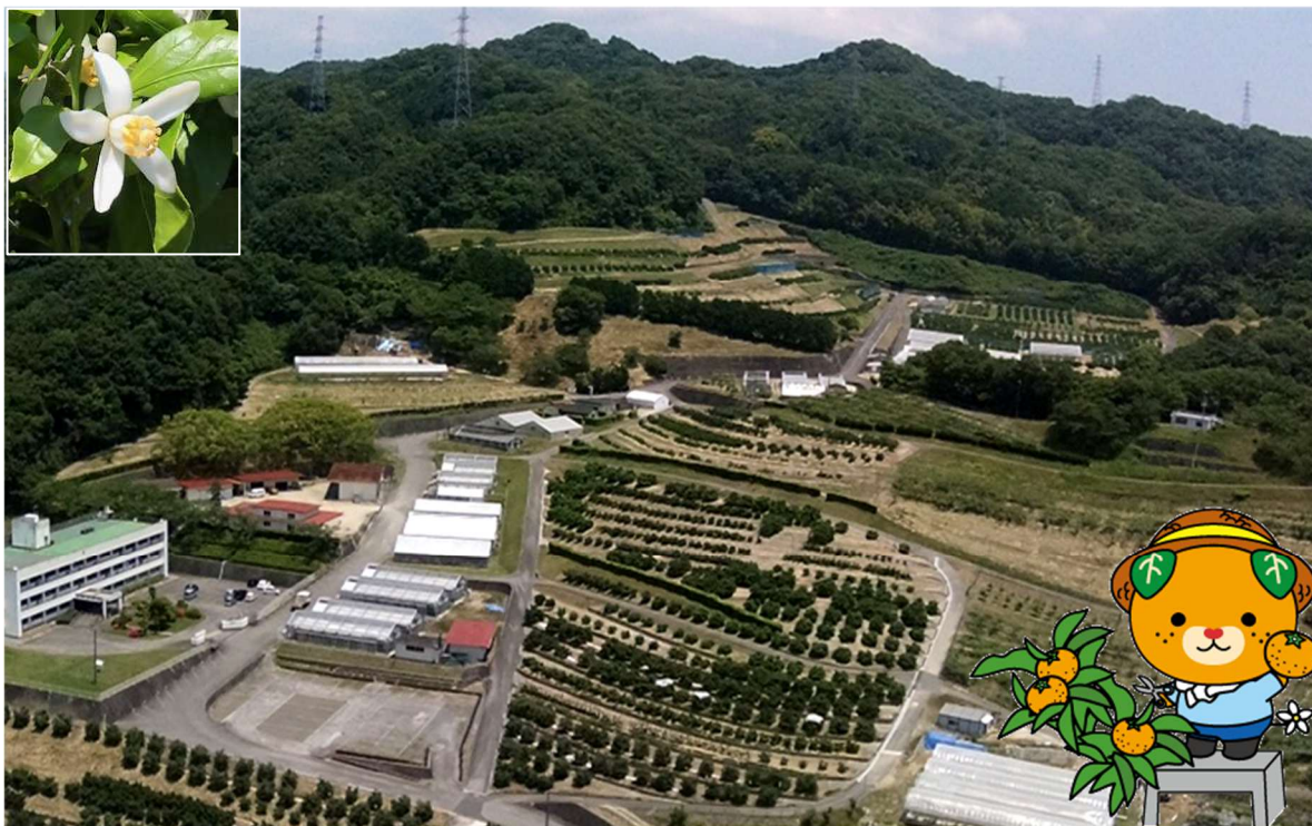
果樹研究センター全景

Ehime Research Institute of Agriculture, Forestry and Fisheries