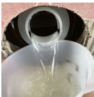
点滴灌水設備を利用した液体石灰肥料による土壌改良

酸性土壌を改善するため、液体石灰肥料と自動液肥灌水システムを利用した土壌改善技術の開発、ドローンを用いた省力施肥について検討を行います。