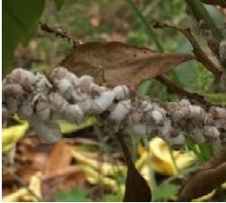
イセリヤカイガラムシ

登録農薬の失効に伴う薬剤の変遷や発生消長のズレにより、増加傾向にある各種カイガラムシの発生消長を把握し、状況に応じた防除対策の確立を目指します。