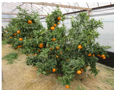
高品質安定生産試験

愛媛県で開発したカンキツ新品種「愛媛果試第48号（紅プリンセス）」のスムーズな産地化を後押しするため、安定的に高品質な果実が生産できる栽培技術や生理障害等の軽減技術の開発、最適な肥培管理・貯蔵条件の検討を行います。