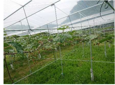
簡易雨よけ栽培による降雨対策