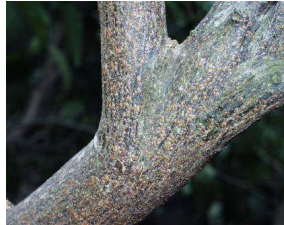
マルカイガラムシ類