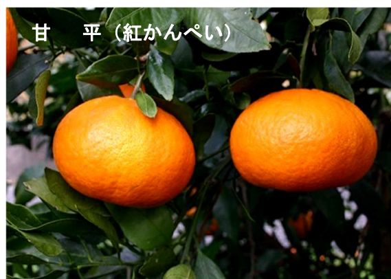
甘 平 (紅かんぺい)