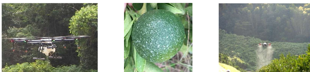
農薬散布用ドローン

カンキツ栽培の労力軽減を目的に、農薬散布用ドローンでの高濃度少量散布が可能な農薬の評価とドローン散布による防除の実用化に向けた研究を行います。