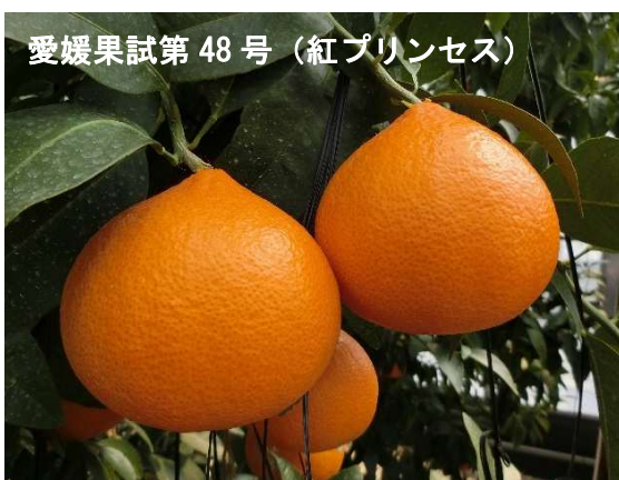
愛媛果試第 48 号 (紅プリンセス)