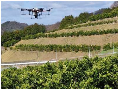
ドローンによる試験散布

カンキツ栽培の労力軽減を目的に、農薬散布用ドローンでの高濃度少量散布が可能な農薬の選抜とドローン実機による防除の実用性を研究します。