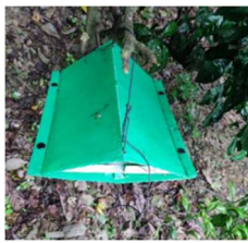
モニタリングトラップの改善試験

カンキツ類の輸出に際し、検疫対象となる病害虫について輸出検疫に対応した検疫処理技術を確認し、国際的な検疫処理基準として輸出相手国に提案のできる技術実証と試験データの蓄積を行います。