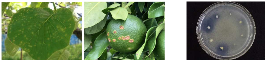
細菌性病害（左：キウイフルーツかいよう病 カンキツかいよう病）

効果的な農薬が少なく対策に限られる細菌性病害を防除するため、抗菌性を持つ有用微生物を活用した防除技術を研究します。