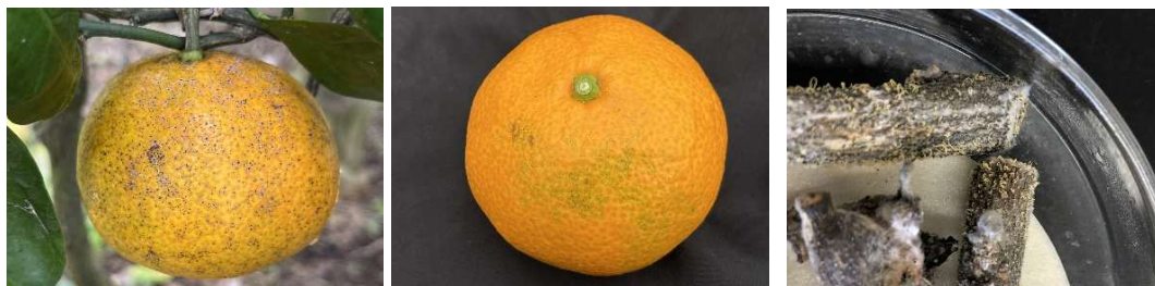
カンキツ黒点病（左：前期感染・右：後期感染）

カンキツ黒点病の被害を低減し、高品質果を生産するため、販売が停止されるマンネブ剤を用いない効果的な薬剤防除体系を確立します。