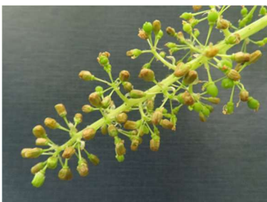
シャインマスカット未開花症状

シャインマスカットの未開花症が全国各地で確認されており、発生要因を調査した結果、土壤水分の多いほ場で発生しやすい傾向でした。関係機関と連携しながら土壤物理性の改善試験を行い、未開花症の発生軽減技術を確立します。