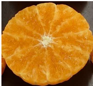
生理障害等軽減技術開発試験