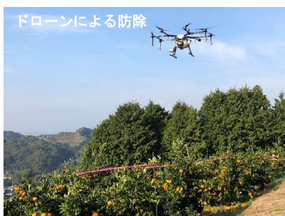
ドローンによる防除