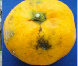
葉・果実のすす病被害