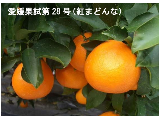
愛媛果試第 28 号 (紅まどんな)