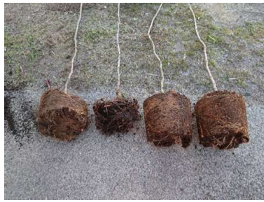
大苗育苗の技術開発