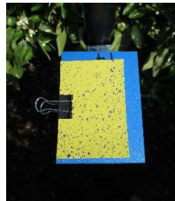
感水紙への薬液付着状況