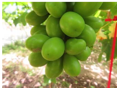
未開花症による奇形果