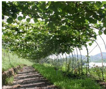
交雑系統の作出・優良系統の選抜

県内の品種はヘイワードに偏る傾向にあり、他産地品種に負けないバラエティーに富んだ新品種の育成が望まれています。また、安心してキウイ栽培ができるよう、かいよう病に強い雌品種や開花が早く花粉量の多い雄品種を育成し、県内キウイ産業の活性化を支援します。