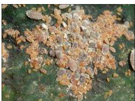
フジコナカイガラムシ

果樹栽培で問題となっている重要害虫の防除試験を実施し、効率的な防除対策を確立します。