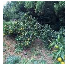
防除と圃地改善による試験