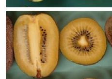
消費者嗜好に合う新品種の育成